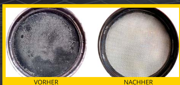
Nach Behandlung mit dem Magneti Marelli Oxhydro Carbon Cleaner; der Gegendruck des gereinigten Partikelfilters nimmt stark ab, was zu einer spürbaren Verringerung des Treibstoffverbrauchs führt.

VERLÄNGERN SIE DIE LEBENSZEIT IHRES MOTORS MIT OXHYDRO!